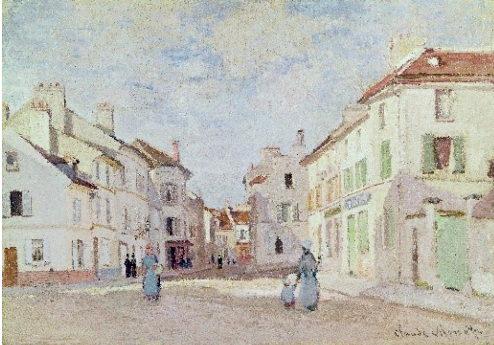
L'ancienne rue de la chaussée, 1872, collection particulière

Cette vue de l'ancienne rue de la chaussée se situe à l'emplacement actuel de la rue du 8 mai 1945. A gauche, le début de la rue des Saints-Pères. A droite, l'angle de la rue Notre-Dame. Un édifice est manquant : la basilique d'Argenteuil. Claude Monet a fait le choix de ne pas la représenter, pour que l'on suive les lignes formées par les bâtiments de part et d'autre de la rue. On appelle cela des lignes de fuite, qui dirigent notre regard vers le centre de la composition.