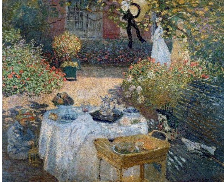
Le déjeuner (Argenteuil), 1873, musée d'Orsay

Une table est dressée à l'ombre des arbres dans un jardin fleuri. Des chaises, une nappe blanche, de la vaisselle et des restes de repas sont visibles. L'ensemble donne une impression de calme après un moment convivial. Le petit Jean est occupé à jouer sur le côté et deux femmes, dont Camille, marchent dans le fond de la composition. A l'arrière-plan, la façade de la maison se dessine.