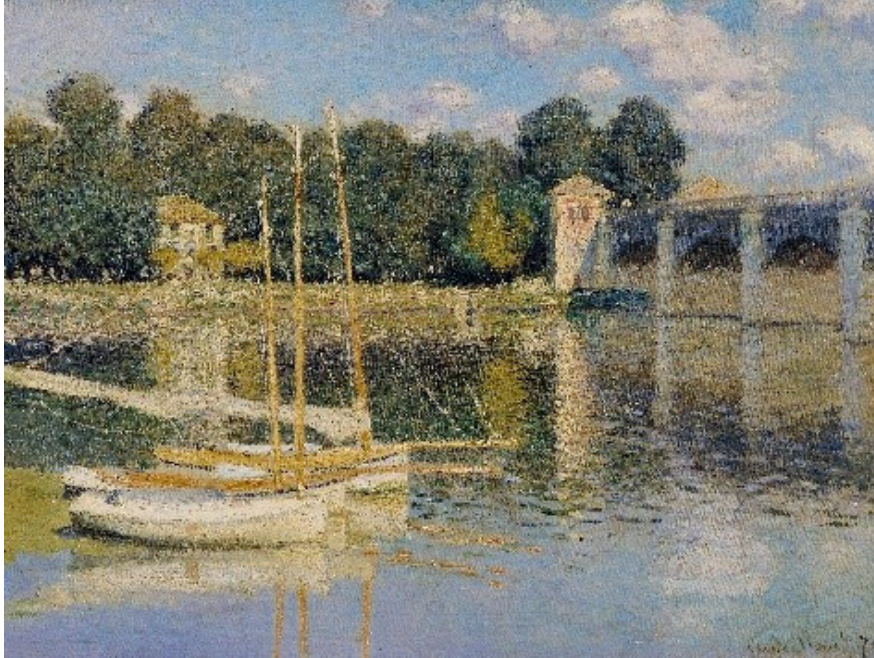
Le pont d'Argenteuil, 1874, musée d'Orsay

Monet représente ici le pont routier d'Argenteuil, tout juste reconstruit en 1874 après sa destruction pendant la guerre franco-prussienne de 1870.