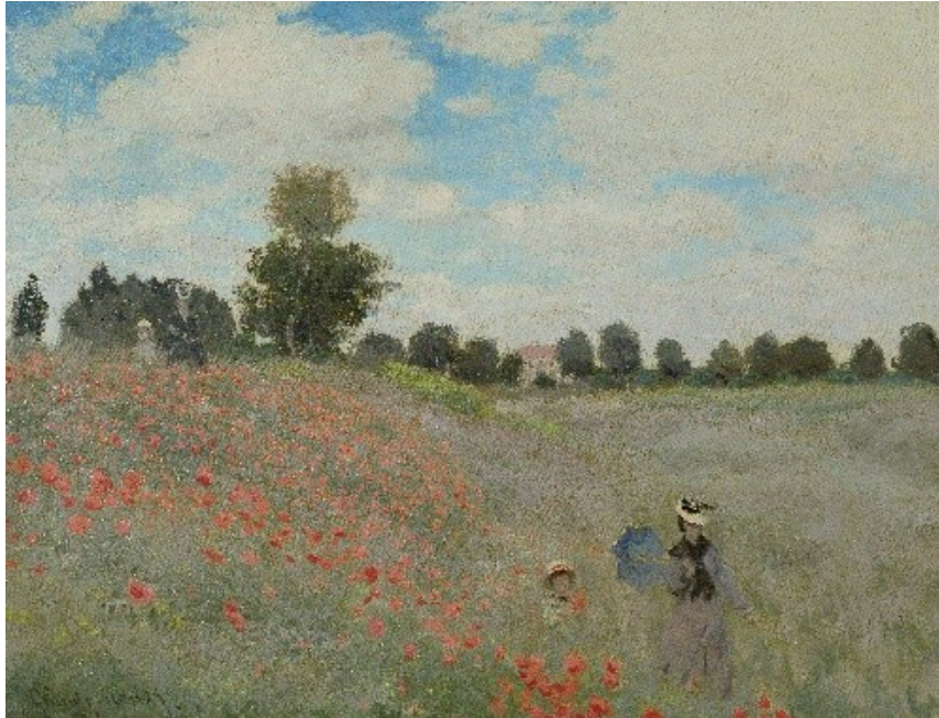
Les Coquelicots d'Argenteuil, 1873, musée d'Orsay

Il s'agit d'une œuvre emblématique de Claude Monet, réalisée peu de temps après son installation à Argenteuil. La scène se déroule dans une campagne verdoyante, où les personnages (Camille Monet et leur fils Jean, représentés deux fois) se promènent. Un jeu de répétition se crée entre ces figures.