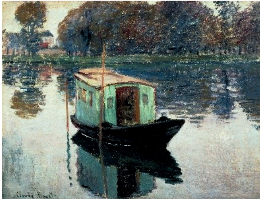
Le bateau-atelier, 1876, Rijkmuseum

Pour ce tableau, Claude Monet donne à voir un outil de travail plutôt qu'un paysage classique. Il représente une embarcation surmontée d'une cabine couverte : il s'agit du bateau-atelier qu'il fit construire par son ami, le peintre et architecte Gustave Caillebotte, afin de peindre au plus près les reflets de la lumière sur l'eau.